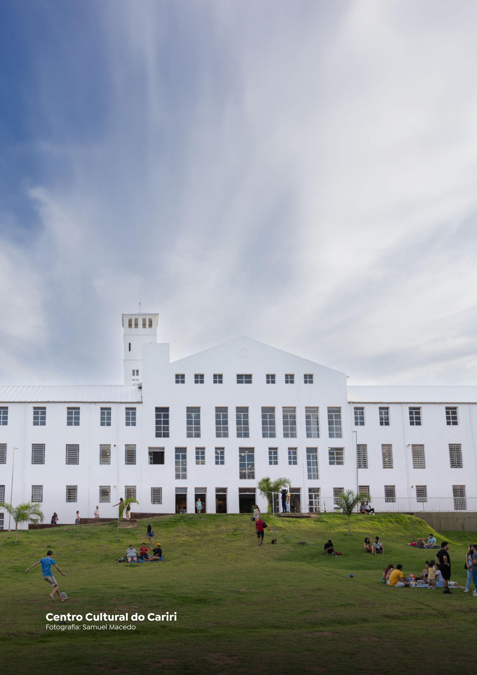
Centro Cultural do Cariri