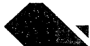
Antônio Gilvan Silva Paiva Secretário Municipal da Cultura de Fortaleza