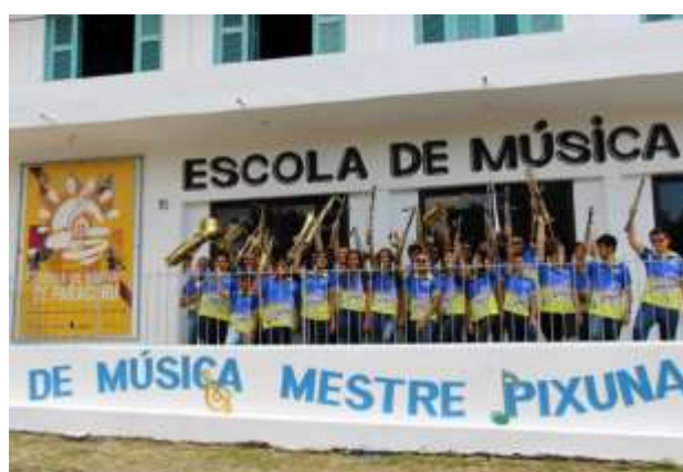
Formação atual de músicos