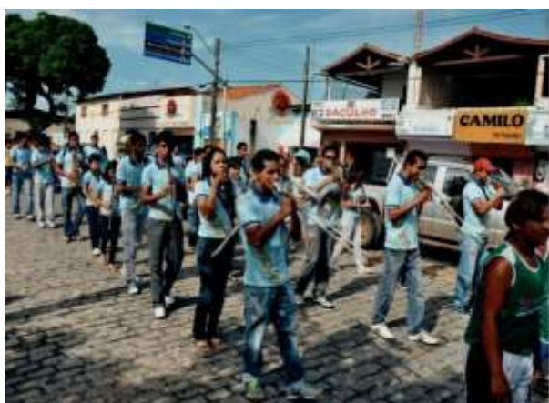
TURMA 2014 A 2016