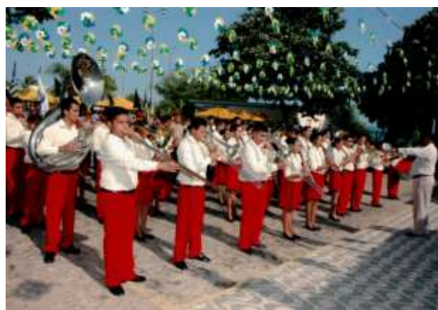
TURMA DE 2010