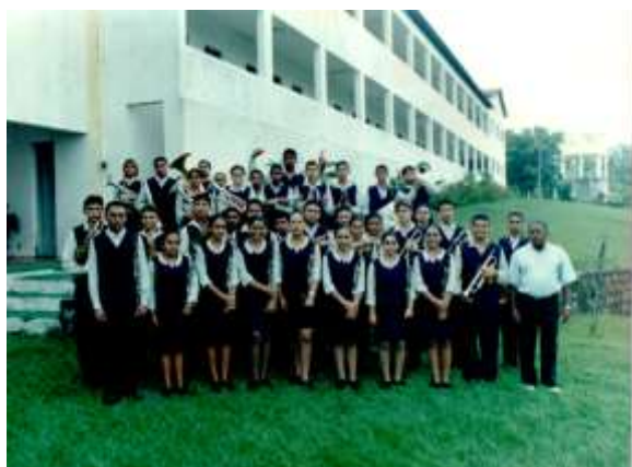
Formação da primeira turmas Banda de Música de Paracuru

A banda composta por instrumentos de sopros e percussivos possui um repertório eclético com sambas, frevos, chorinhos, pop rock, MPB, xotes, xaxados, dobrados, música internacional, clássicos infantis, músicas circenses e outras, que encanta o público que a prestigia.