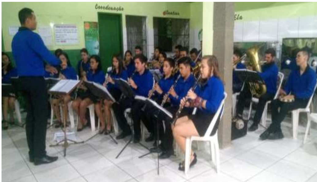
Turma 2019/2020 e 2021