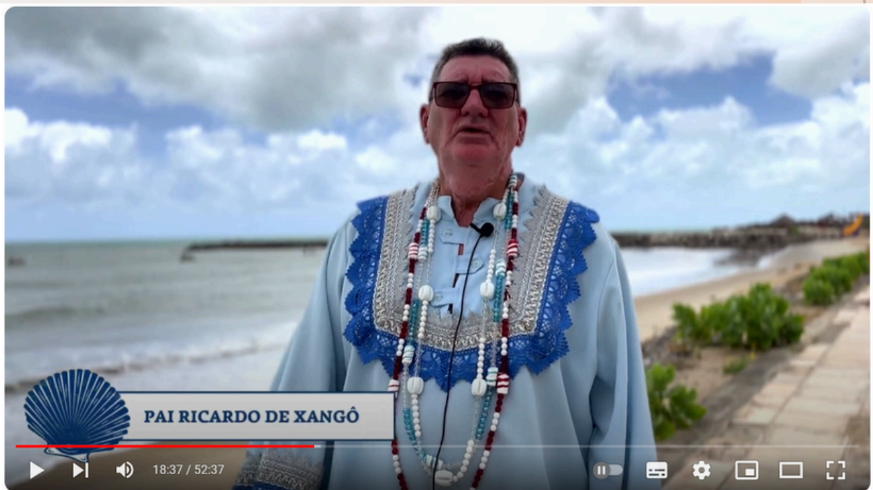
8 anos da Tradicional Festa de Yemanjá no atterro da Praia de Iracema

clique nas imagens para acessar os links