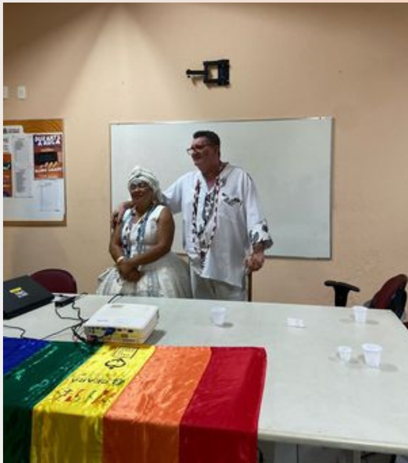
Momento de inicio da mesa Genero nas casas de terreiro. (2023) Local - CUCA Barra do Ceara.

O seminário Pai Luiz de Aruanda integra a programação da festa em homenagem aos Pretos Velhos que ocorre desde 2010.