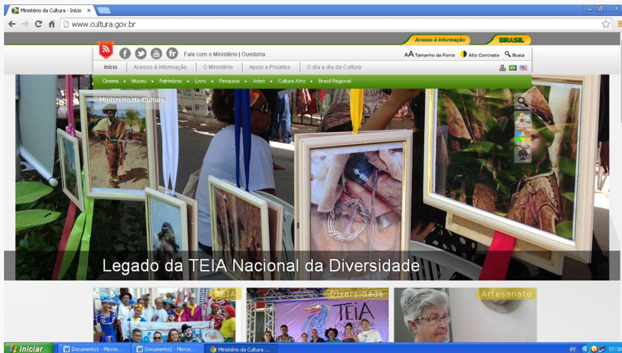
Foto de Capa do Ministério da Cultura – Exposição o Vaqueiro e o Couro. O INSTITUTO integrou as ações do TEIA 2014.

Produção de Várias Exposições em Artes Visuais, entre elas o Vaqueiro e Couro, que integrou a Mostra Artística do TEIA nacional 2014.