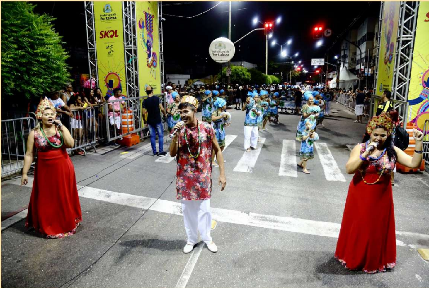
Avenida Domingos Olímpio - 2018