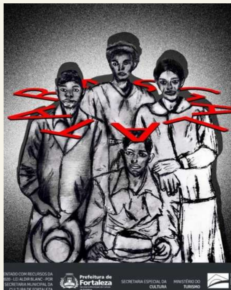
Podcast Rasga Lata - 2022 ( Entre fotografias e memórias / Spotify)