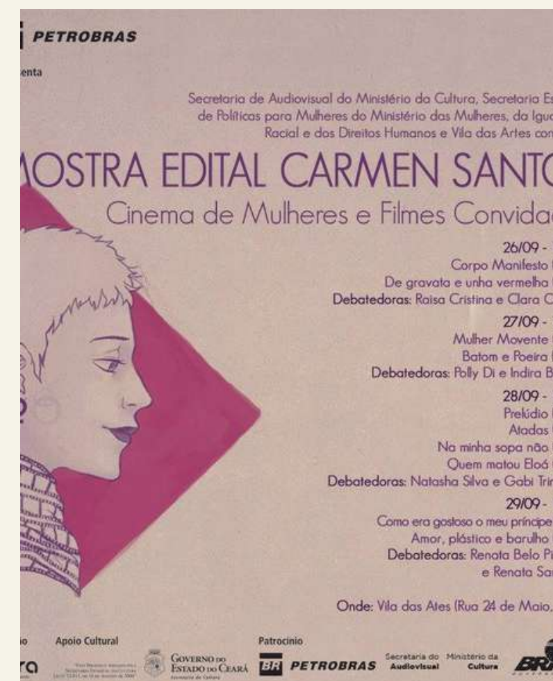
Organização e Curadoria da Mostra Edital Carmen Santos - Vila das Artes -2018