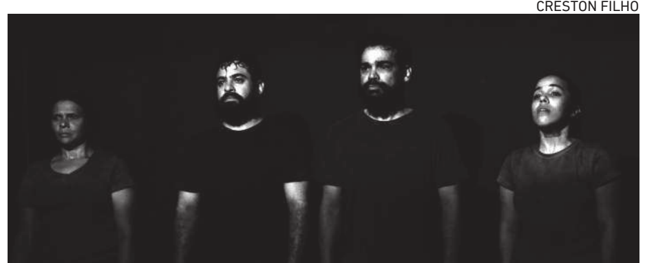
ESPETÁCULO “O ano que não acabou” integra o projeto “#HerêAquinoMundo”

Quando: quarta-feira, 31 de março, às 19 horas Onde: no canal do Youtube Grupo Expressões Humanas