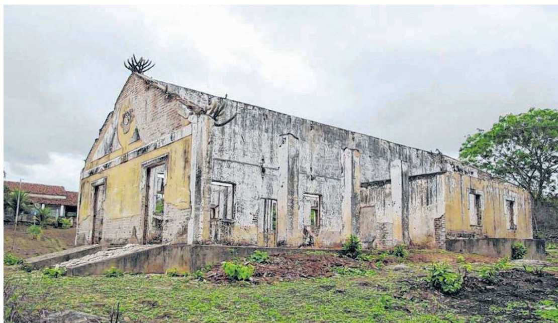
Conjunto arquitetônico reconhecido como campos de concentração em Senador Pompeu foi tombado em 2019