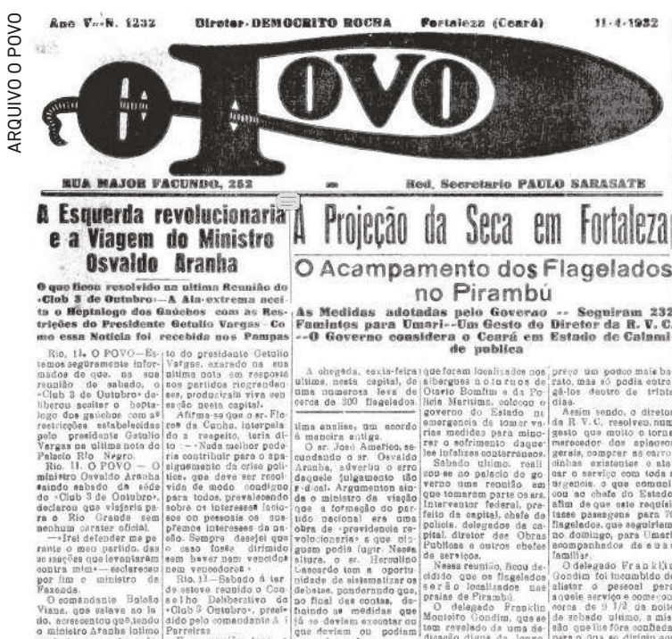
Registros do O POVO sobre a seca de 1932