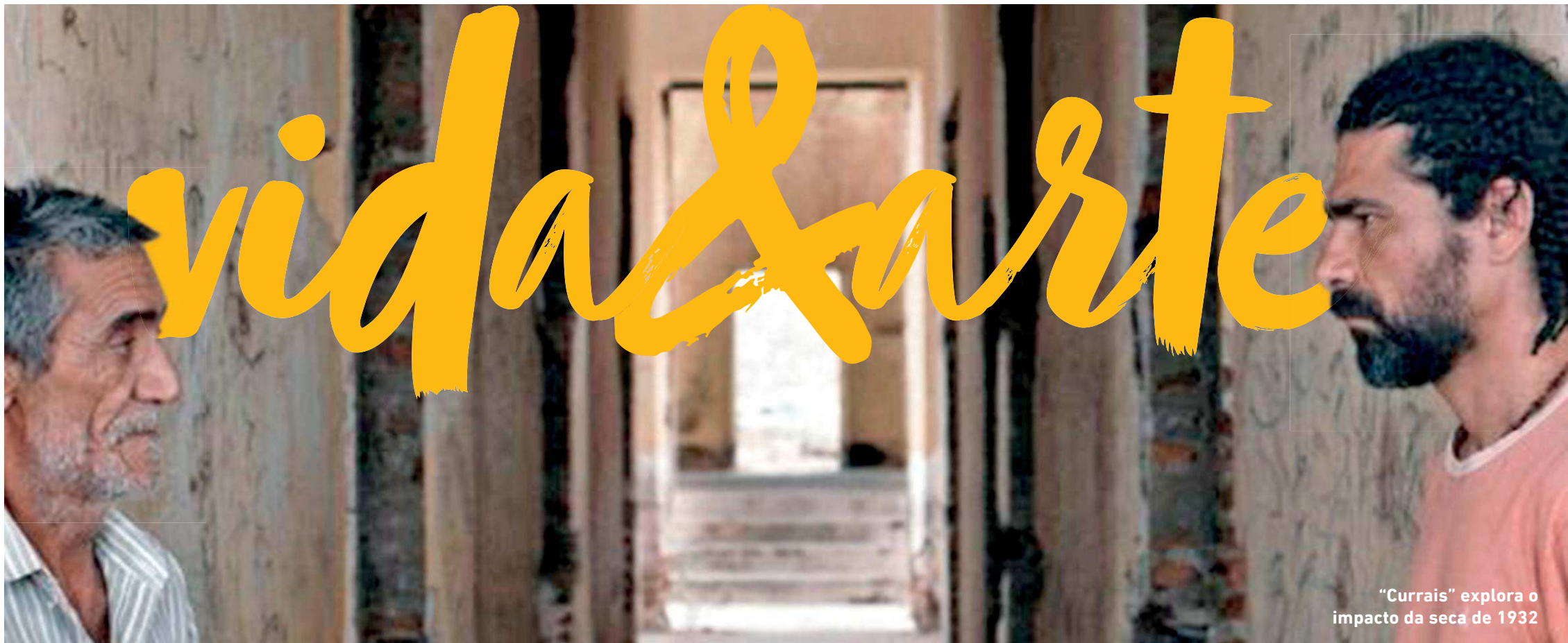
“Currais” explora o impacto da seca de 1932