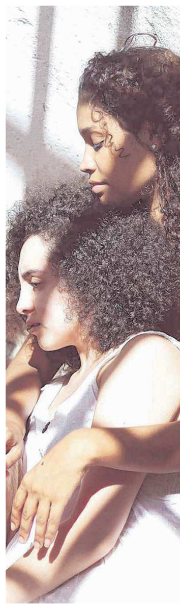
“Trinta e Duas” estreou em 2017 no Theatro José de Alencar

Fortaleza se tornasse a sétima cidade urbana em tamanho no Brasil. Desde então, os flagelados eram confinados pelo governo. Em 1932, o modelo já havia se consolidado e contabilizava, de acordo com registros da época, mais de 73.918 pessoas.