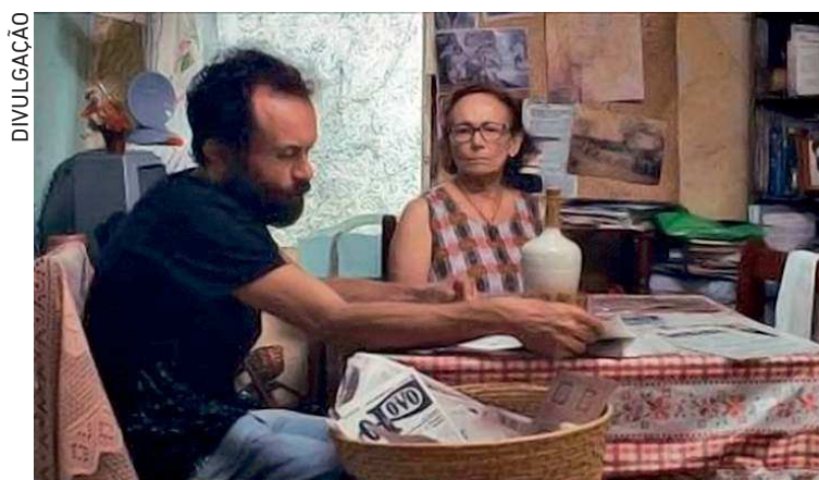
“Currais” transita entre as linguagens de ficção e documentário