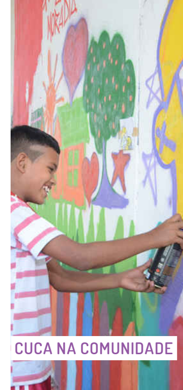
CUCA NA COMUNIDADE

Atividades e formações na área de comunicação, que fortalecem o protagonismo de jovens comunicadores, por meio de projetos como Repórter Cuca, Radioescola, Encontros com Comunicadores e ações permanentes na área de produção de conteúdo e democratização da comunicação.