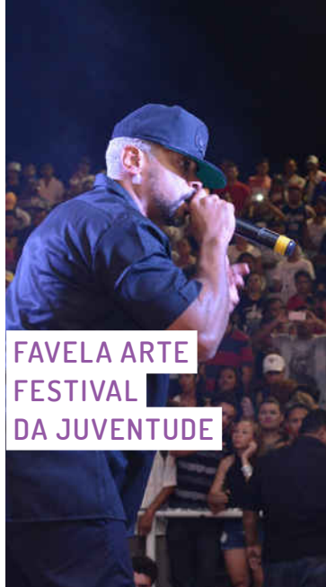
FAVELA ARTE FESTIVAL DA JUVENTUDE

Projeto cujo objetivo é realizar anualmente a tradicional festa popular junina, promovida pela Rede Cuca, com apresentações de quadrilhas e grupos regionais, montagem de feira criativa temática e decoração específica dos festejos juninos. No ano passado, a festa foi a maior da capital cearense.