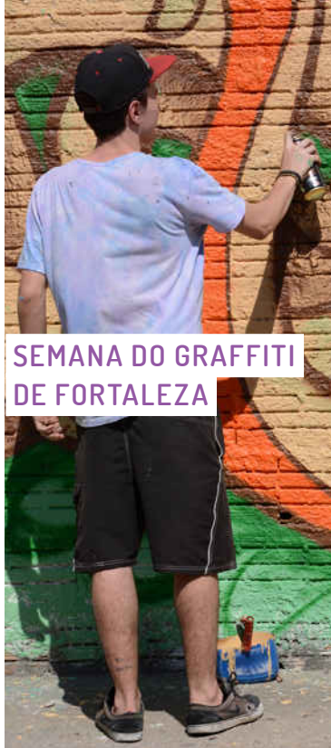
SEMANA DO GRAFFITI DE FORTALEZA

Tornou-se um tradicional evento deste segmento da arte urbana e proporciona uma programação gratuita com oficinas, palestras e ações diretas de arte urbana nos muros da cidade. Na última edição, mais de 40 grafiteiros foram escolhidos, por meio da avaliação, e produziram um grande painel nos muros da Universidade Federal do Ceará.