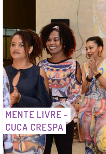
MENTE LIVRE - CUCA CRESPA

Com o intuito de realizar uma série de atividades para discutir questões relacionadas ao amor e à Juventude, com ênfase na inclusão, acolhimento, orientação, afeto, espiritualidade e, principalmente, desenvolvimento humano, o projeto promove uma série de apresentações culturais, rodas de conversa e oficinas, trabalhando como tema a diversidade religiosa brasileira, que influencia diretamente a nossa cultura popular e crenças.