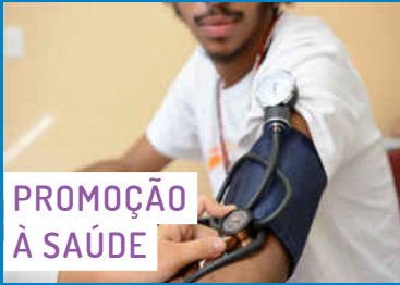
PROMOÇÃO À SAÚDE