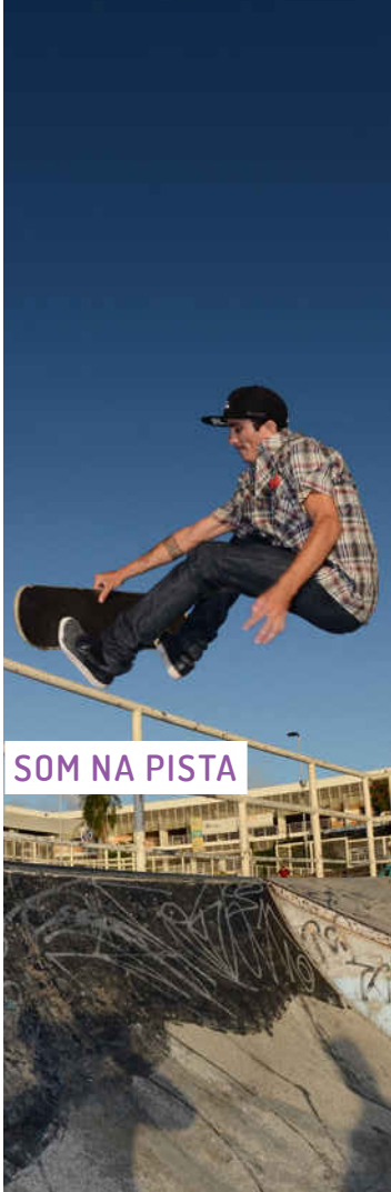
SOM NA PISTA

Ação de fruição musical por meio de eventos de discotecagem musical em estilos variados, conforme demanda dos jovens, nas pistas de skate da Rede Cuca.