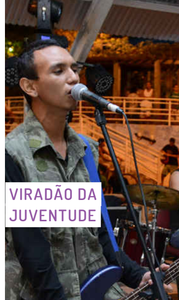
Viradão da Juventude

Um grande encontro que converge culturas da periferia nas mais diferentes linguagens e estéticas urbanas de rua. O objetivo é realizar uma ação anual, com encontros e debates sobre arte e cultura, protagonismo, economia criativa, audiovisual e música, além de realizar uma programação cultural específica com artistas locais, regionais e nacionais ligados a cultura de periferia. Busca-se fortalecer a cultura urbana produzida nas favelas e promover os talentos da juventude de periferia.