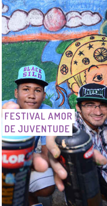
FESTIVAL AMOR DE JUVENTUDE

Tornou-se um tradicional evento deste segmento da arte urbana e proporciona uma programação gratuita com oficinas, palestras e ações diretas de arte urbana nos muros da cidade. Na última edição, mais de 40 grafiteiros foram escolhidos, por meio da avaliação, e produziram um grande painel nos muros da Universidade Federal do Ceará.