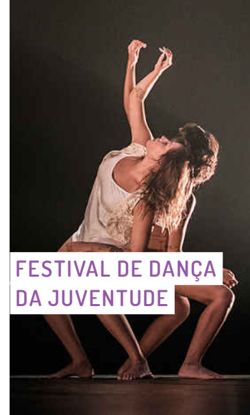
FESTIVAL DE DANÇA DA JUVENTUDE

Evento em comemoração ao Dia Internacional da Juventude, com atividades acontecendo durante 24 horas, nas mais diversas áreas: esporte, teatro, comunicação, dança, cinema, música, literatura, jogos, circo, com oficinas, rodas de conversa e debates. Na primeira edição, realizada em agosto de 2016, os Cucas receberam mais de 100 atividades diferentes, além de ter alcançado um público de mais de 6 mil pessoas, em sua grande maioria jovens com idade entre 16 e 29 anos.