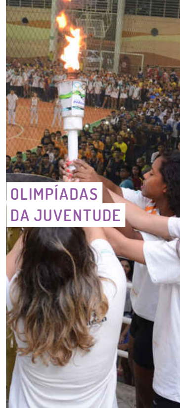
OLIMPIADAS DA JUVENTUDE

Cotidianamente, a cultura negra é trabalhada na Rede Cuca. E, durante o mês de novembro, tradicionalmente, é realizada uma programação com ações voltadas para a difusão e discussão do tema. Assim, a campanha visa realizar uma série de atividades de formação, difusão e fruição sobre a cultura afro-brasileira, com uma programação cultural diversificada, além de cursos, oficinas, palestras e rodas de conversas temáticas, com o objetivo de promover e valorizar a cultura afro-brasileira, empoderar a juventude negra e combater o racismo e preconceitos.