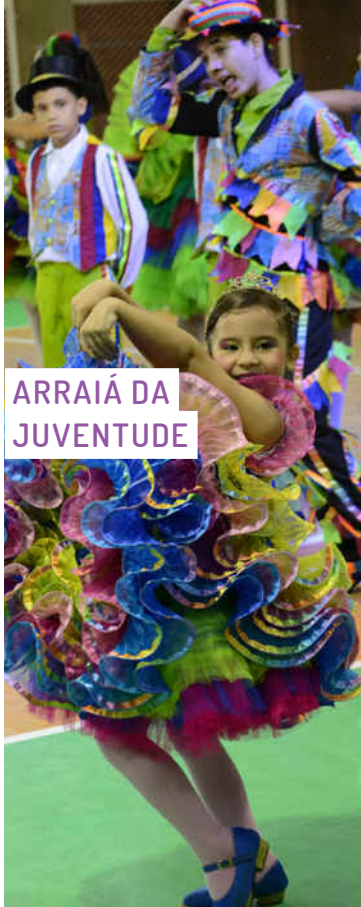
ARRAIÁ DA JUVENTUDE

Projeto cujo objetivo é realizar anualmente a tradicional festa popular junina, promovida pela Rede Cuca, com apresentações de quadrilhas e grupos regionais, montagem de feira criativa temática e decoração específica dos festejos juninos. No ano passado, a festa foi a maior da capital cearense.