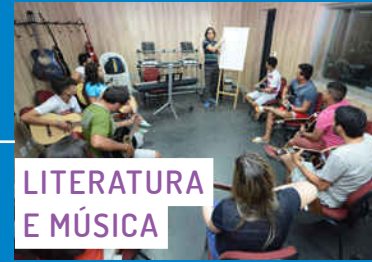
LITERATURA E MÚSICA