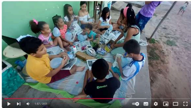
Oficina de máscaras com introdução ao careta do cariri