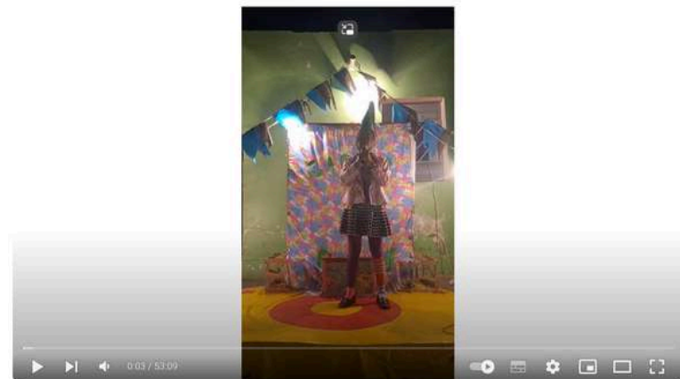
Circo de quintal 2024, ensaio experimental.