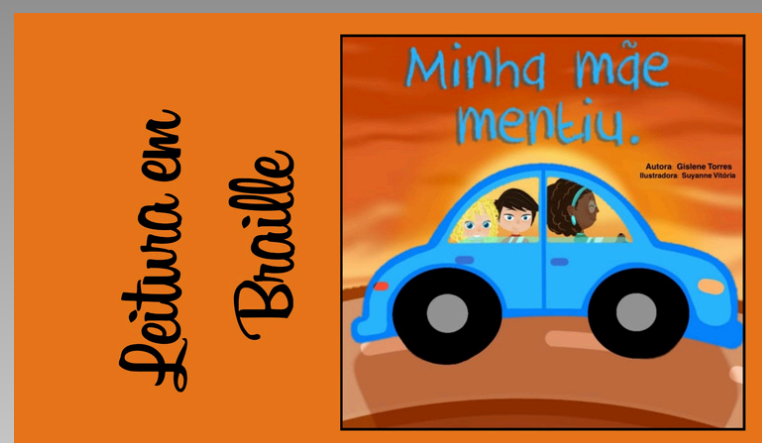
Livro em Braille (2025)