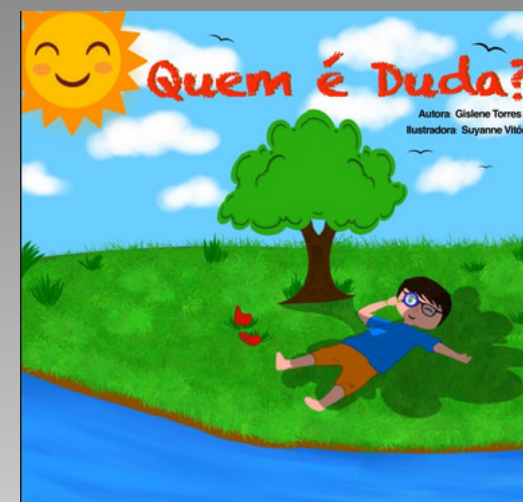
Livro em tinta Quem é Duda? (2025)