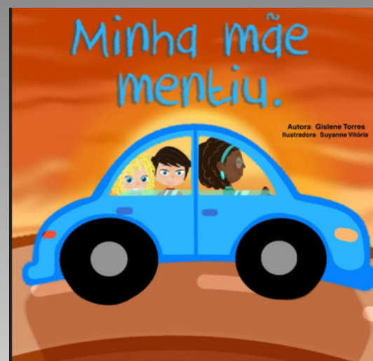
livro em tinta Minha mãe Mentiu (2025)

O LANÇAMENTO DOS LIVROS ACONTECEU EM ABRIL DE 2025, NA BIBLIOTECA DO INSTITUTO DOS CEGOS DE FORTALEZA E AS OBRAS FORAM LANÇADAS COM LIVROS EM TINTA(TRADICIONAL), EM BRAILLE E AUDIOLIVROS.