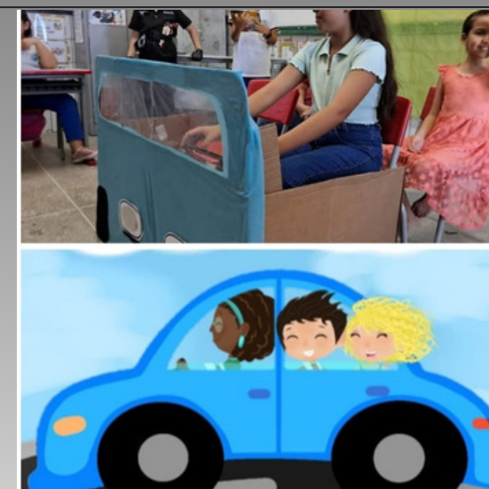
Tema do livro sendo trabalhado em sala, de forma lúdica