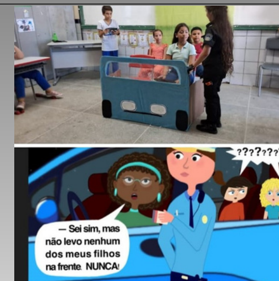
Tema do livro sendo trabalhado em sala, de forma lúdica