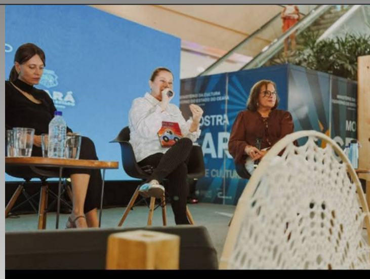
Mostra Ceará de Turismo e Cultura

OS LIVROS FORAM SELECIONADOS PARA A EXPOSICAO DO EVENTO "CEARÁ TURISMO E CULTURA." ELES TAMBÉM FORAM UTILIZADOS DE FORMA LÚDICA POR PROFESSORES QUE APOIARAM O TRABALHO.