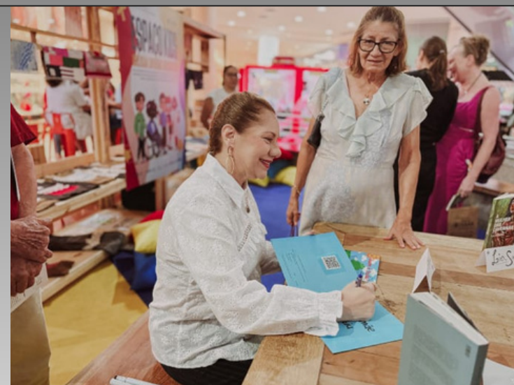
Mostra Ceará de Turismo e Cultura