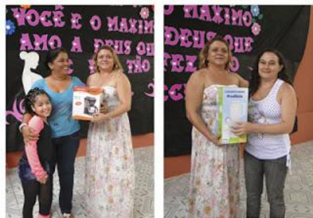
Sorteios de Presentes para as Mães