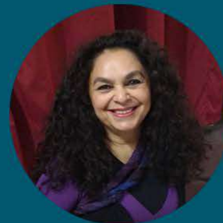
COORDENAÇÃO REJANE REINALDO (BRASIL/TEATRO DA BOCA RICA)