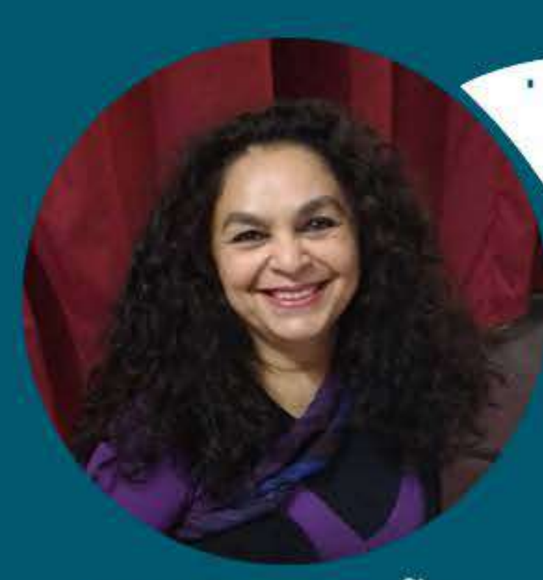
COORDENAÇÃO REJANE REINALDO (BRASIL/ TEATRO DA BOCA RICA)