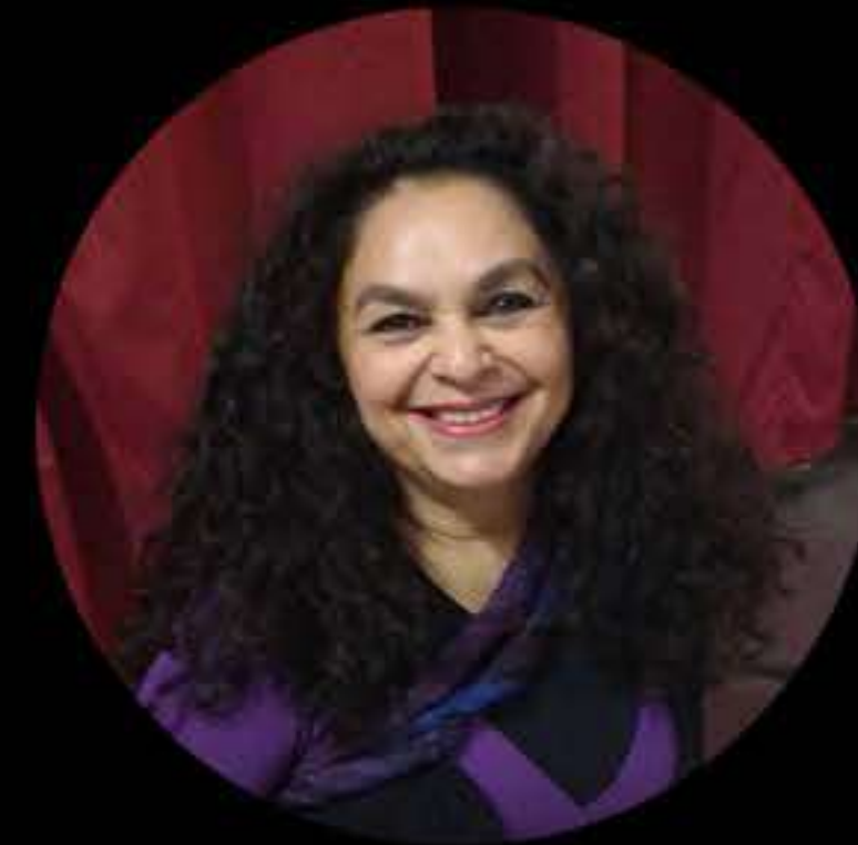
COORDENAÇÃO REJANE REINALDO (BRASIL/ TEATRO DA BOCA RICA)