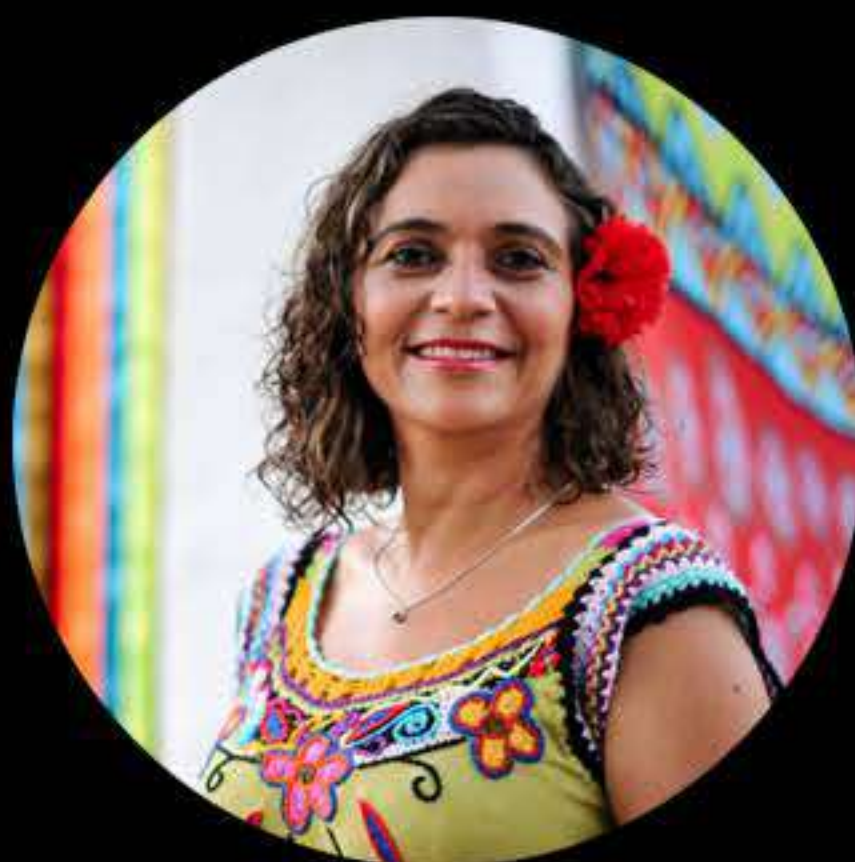
DANE DE JADE (BRASIL/FIMC)