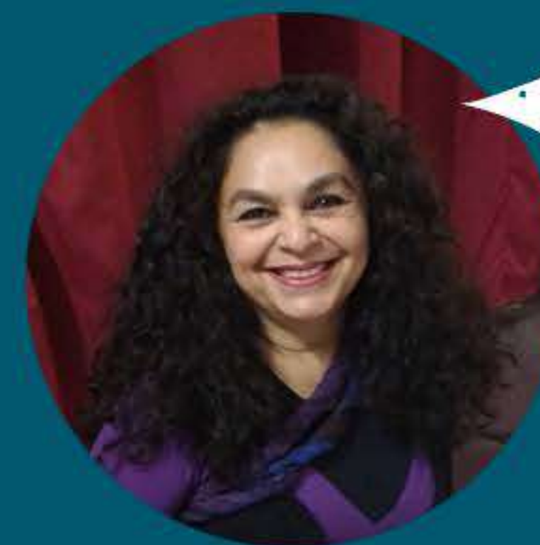
COORDENAÇÃO REJANE REINALDO (BRASIL/ TEATRO DA BOCA RICA)