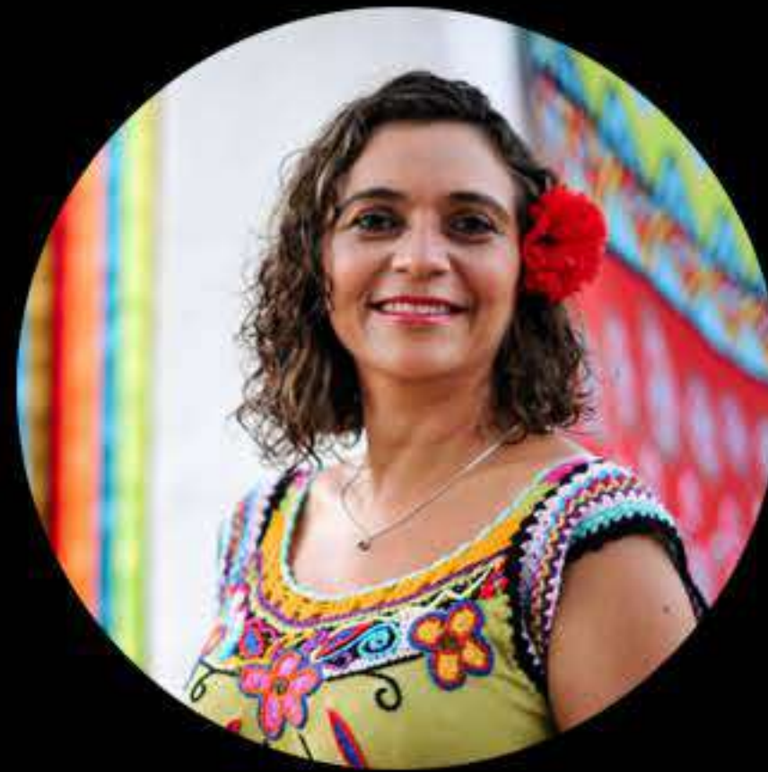
DANE DE JADE (BRASIL/FIMC)